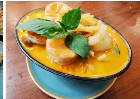
Rotes Curry mit Garnelen