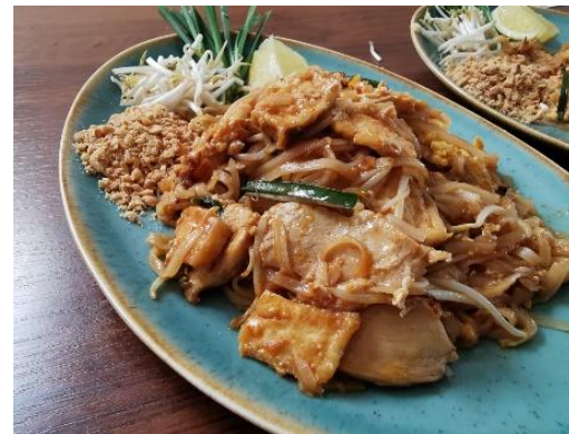
Phad Thai Gai